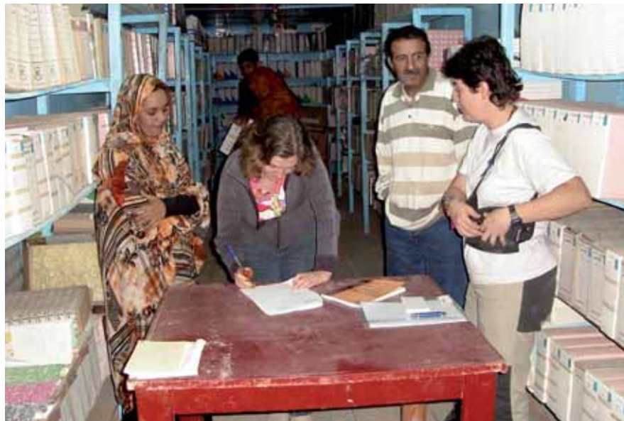
Curs de formació arxivística per tal d'organitzar l'Arxiu Nacional Sahrauí. Campaments sahrauí a Tinduf. Algèria, novembre de 2007