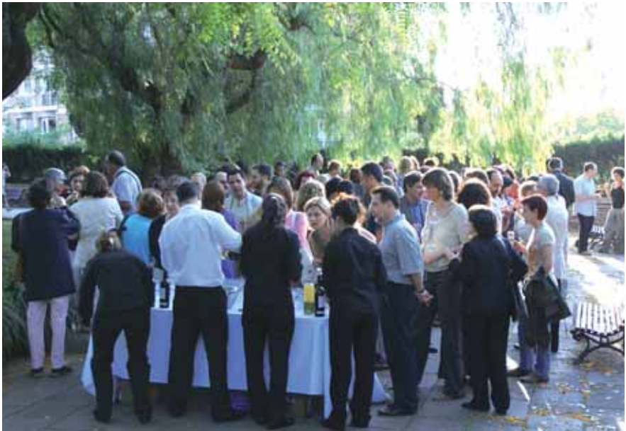
Acte amb motiu de la celebració dels deu anys d'AsF al Museu Marítim de Barcelona. 19 de juny de 2008