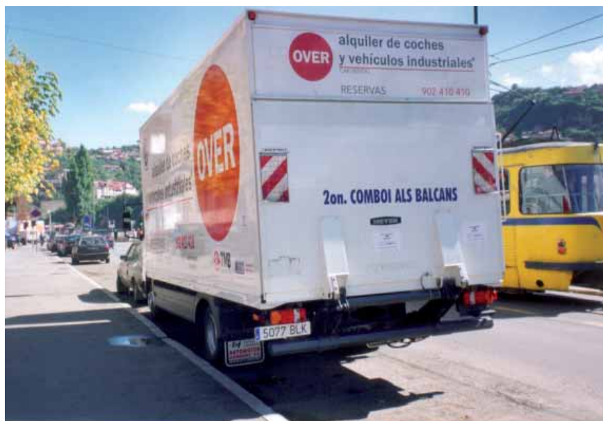
Arribada del material d'arxiu per l'Arxiu Nacional de Bòsnia i l'Arxiu Municipal de Sarajevo. 2001