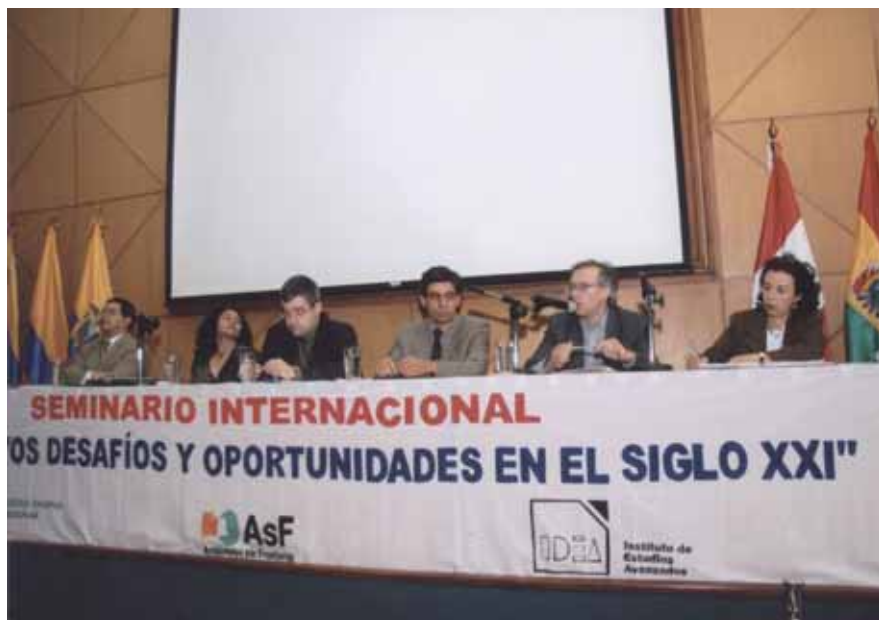
Seminari Arxiu: Reptes i Oportunitats al Segle XXI. Universitat Andina Simón Bolívar, Seu-Ecuador (UASB-E). Quito, Equador, 2005