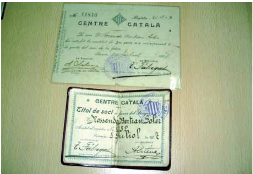
Documents de l'Arxiu del Casal Català de Rosario, Argentina, octubre de 2007 Autora: Fina Solà. Arxiu: AsF