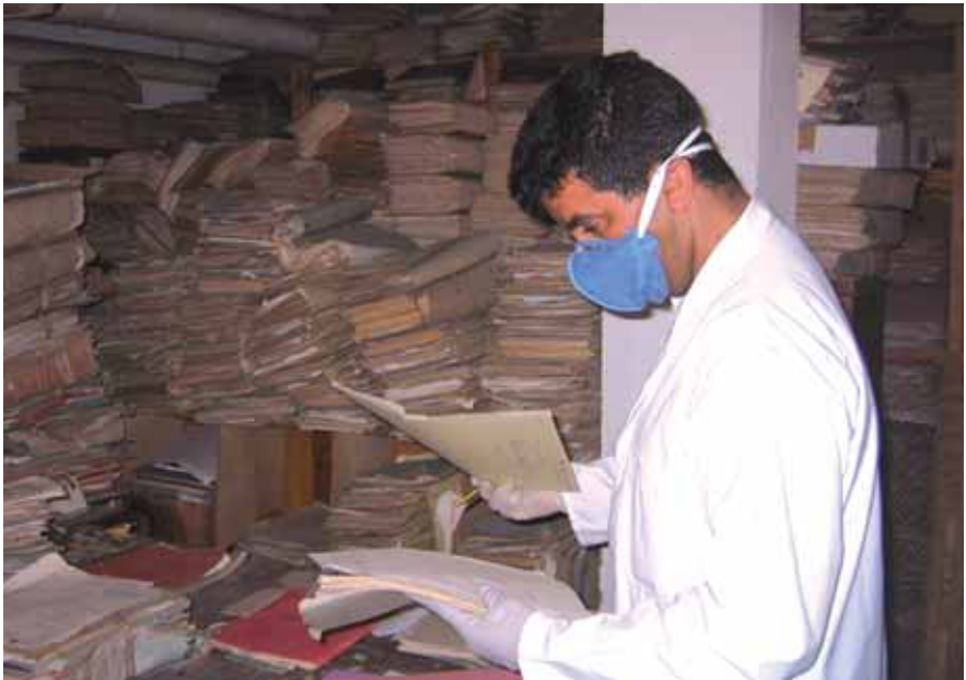
Camp de treball per a l'organització i ordenació de la documentació d'urbanisme de la Comuna Urbana de Fes. Marroc, 2005 Autor: Àngel Soler