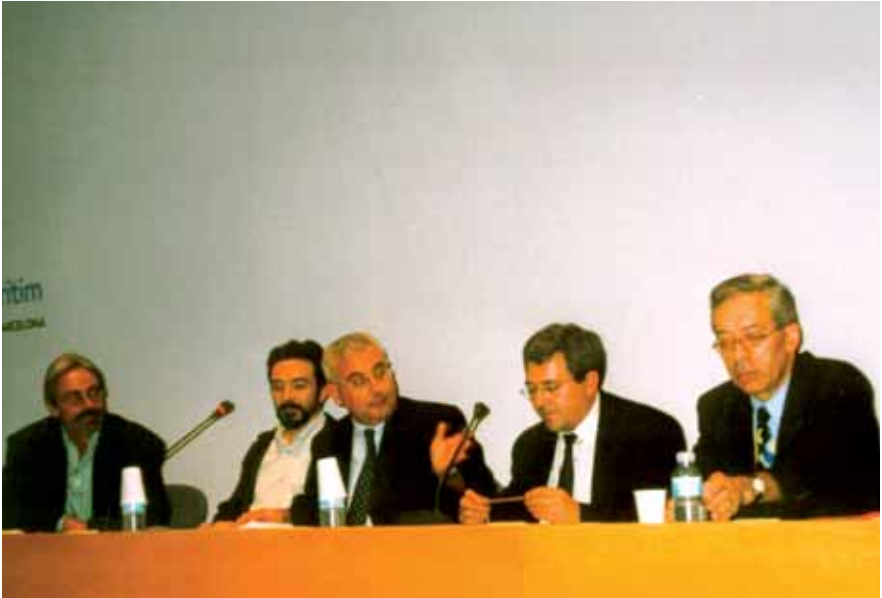
I Jornades d'AsF "La Protecció del Patrimoni Documental en l'Àmbit de la Cooperació Internacional". Museu Marítim de Barcelona, octubre de 2001