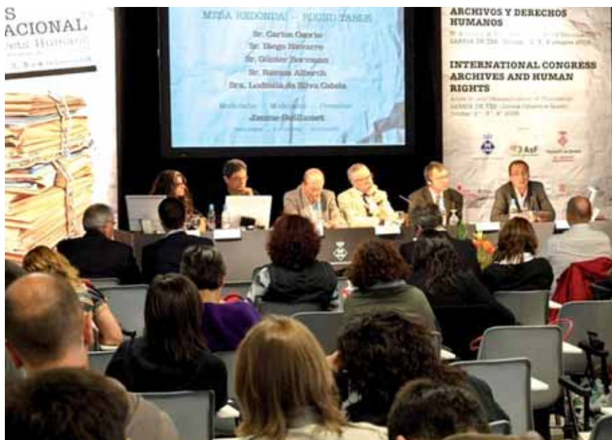
Congrés Internacional Arxius i Drets Humans. Sarrià de Ter, Espanya. 3, 4 i 5 d'octubre de 2008