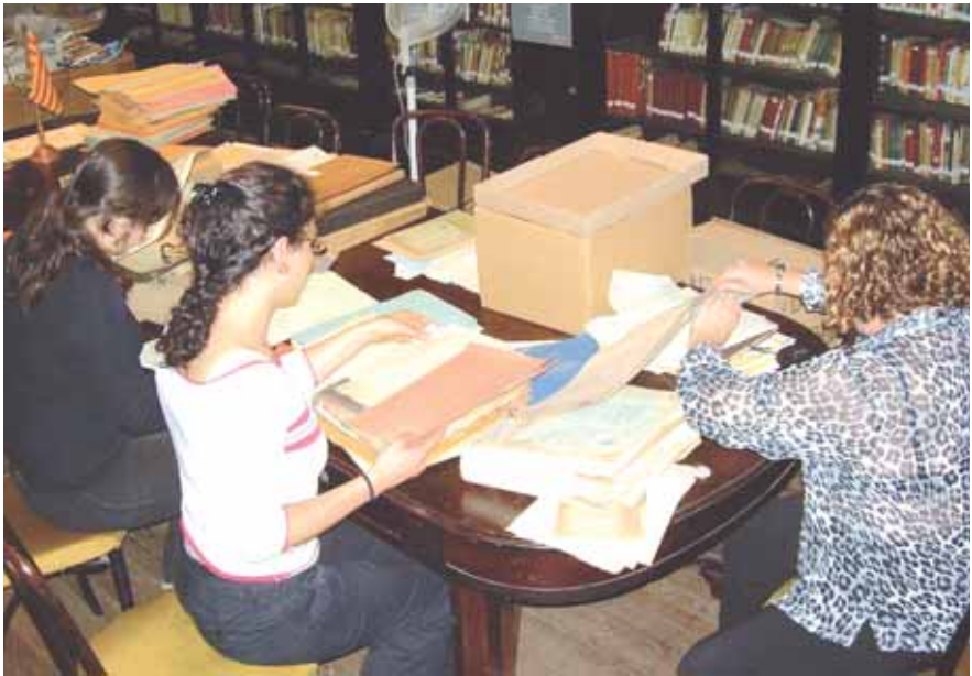
Organitzant l'Arxiu del Casal de Catalunya de Buenos Aires, Argentina, octubre de 2007