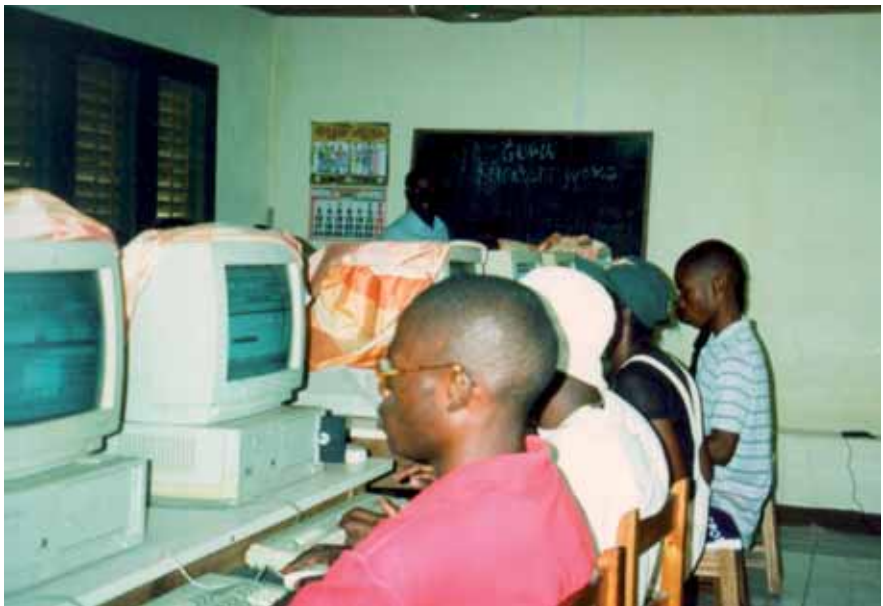
Curs de formació a Malabo i donació d'ordinadors per a la creació de dues aules d'informàtica a les ciutats de Malabo i Bata. Guinea Equatorial, 1999