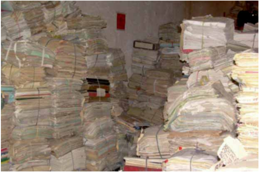
Visita a un dipòsit de l'Archivo Histórico de la Policía Nacional de Guatemala durant els actes de constitució del Consejo Consultivo Internacional del Proyecto de Recuperación del Archivo Histórico de la PN de Guatemala. Març de 2007