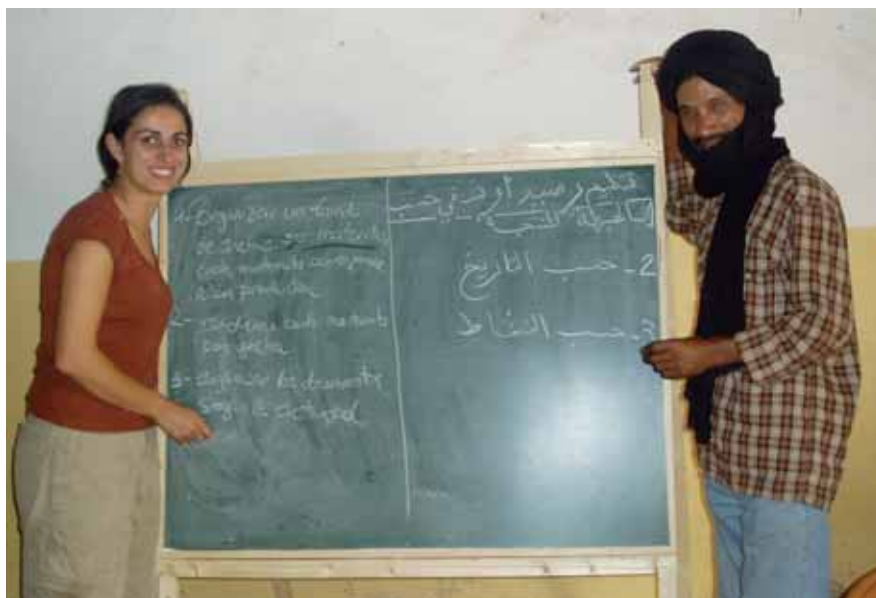
Curs de formació a l'Escola de la Dona, Campament 27 de febrer del poble sahrauí, Tinduf, Algèria. Octubre de 2007