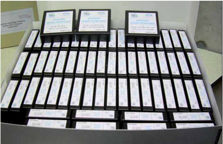
Donació de microfilms de l'Arxiu de la Prelatura de São Félix do Araguaia del bisbe Pere Casaldàliga a l'Arxiu Nacional de Catalunya. Barcelona, 2007