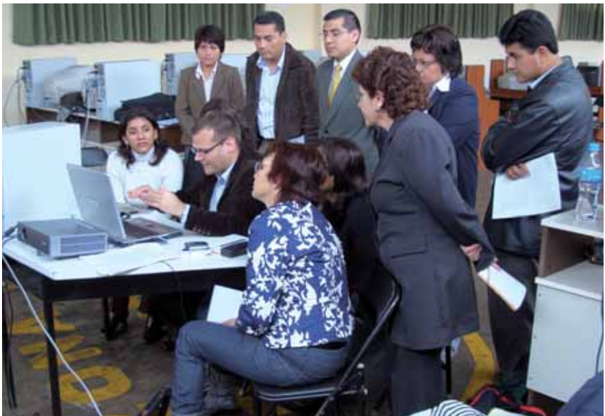
Seminari Taller de Gestió de Documents Electrònics. Lima, Perú, 2008