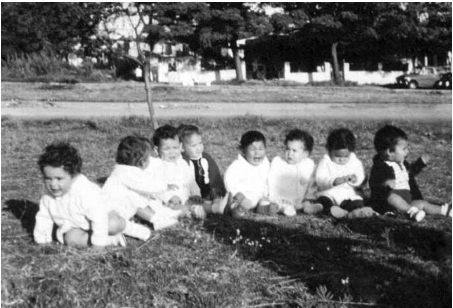
Projecte “Els nens de la presó durant la dictadura militar a Uruguai.” Foto realitzada a Montevideo, 1973