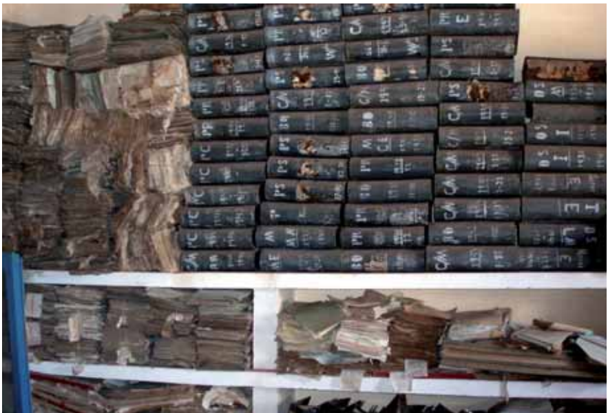
Fons de la duana d'Ilha Ibo, Moçambic, on es conserva documentació del comerç marítim. Octubre de 2006