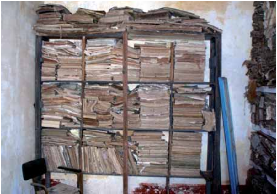
A l'Arxiu Municipal d'Ibo, Moçambic, s'hi va fer un estudi de prospecció. Octubre de 2006