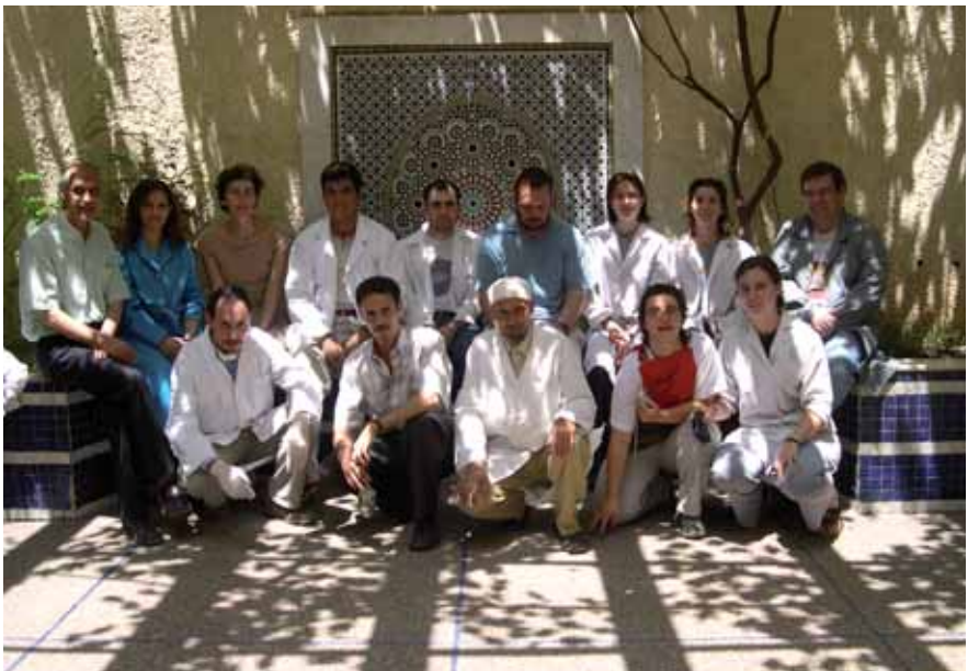
Segon grup de cooperants d'AsF a l'Arxiu de la Comuna de Fes. Marroc, juny de 2005